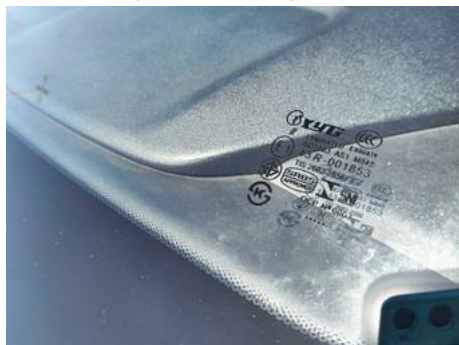
Pare-brise (Autre Défaut)